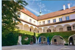
Netzwerken in Freising: Der Domberg (oben), der Domhof (links) und der Kapitelsaal (unten).